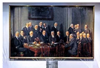
« Portraits des maîtres des forges en 1914 » de Alphonse DECHENAUD Tableau situé au siège de l'UIMM